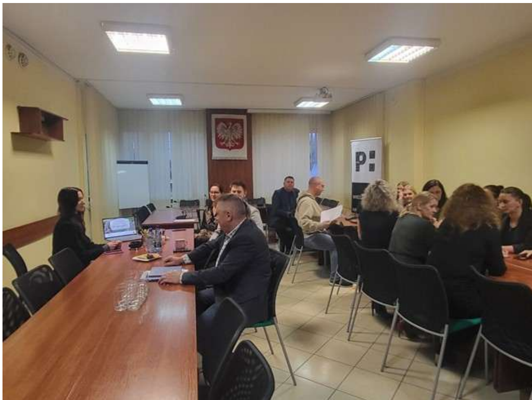
Rycina 3. Spotkanie informacyjne dla mieszkańców, radnych gminy oraz sołtysów.

streszczenie w języku niespecjalistycznym - wersja do konsultacji społecznych