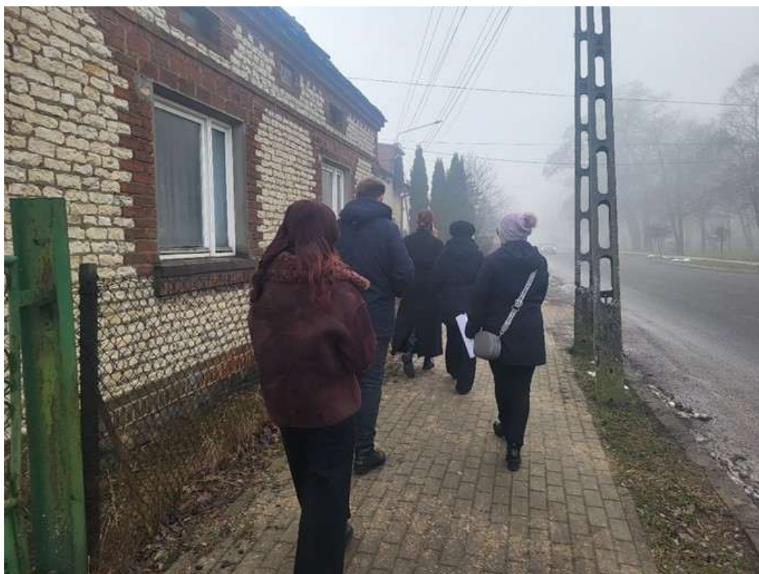
Rycina 4. Spacer badawczy na ulicach Grabowa.