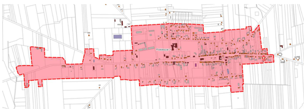
Rycina 1. Obszar rewitalizacji Gminy Grabów - Podobszar 1 GRABÓW. Podkład: Baza Danych Obiektów Topograficznych BDOT 10k.

Na podstawie szczegółowych analiz i wskaźników wyznaczono dwa podobszary rewitalizacji obejmujące części dwóch sołectw: Grabów i Besiekiery. Łączna powierzchnia obszaru rewitalizacji wynosi 144,32 ha, co stanowi około 0,93 % powierzchni gminy. Mieszka tam 960 osób, czyli około 16,70 % całej ludności gminy.