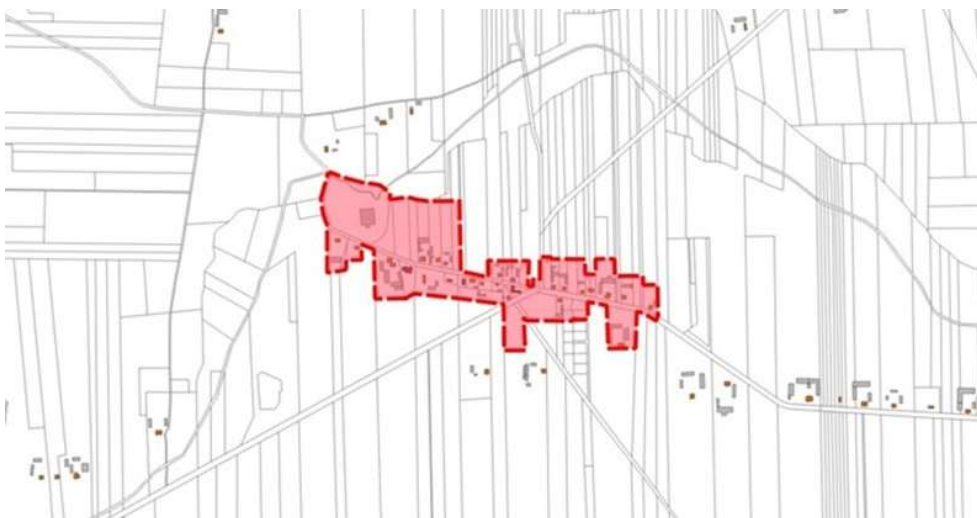
Rycina 2. Obszar rewitalizacji Gminy Grabów - Podobszar 2 BESIEKIERY. Podkład: Baza Danych Obiektów Topograficznych BDOT 10k.

streszczenie w języku niespecjalistycznym - wersja do konsultacji społecznych